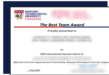
科研素养提升最佳小组证明（样本）