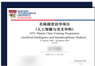
前沿交叉学科证书（样本）